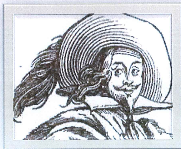
François de Civille