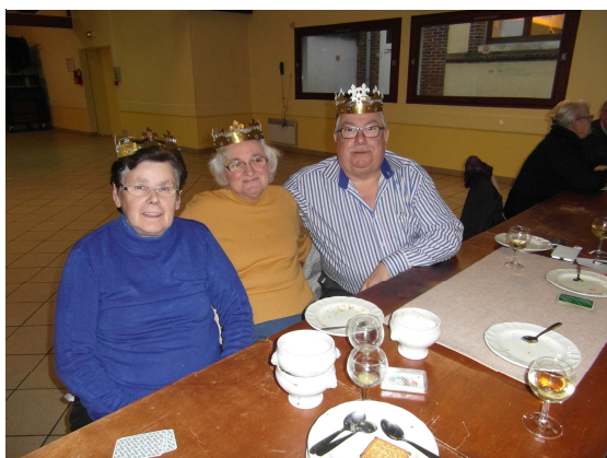
29 janvier : galette des rois