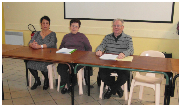
23 janvier : assemblée générale