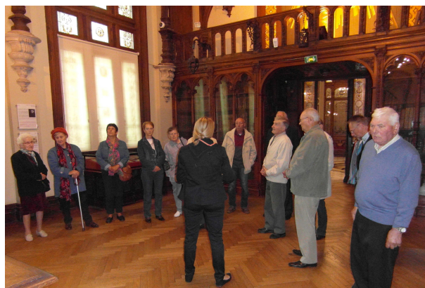
...et repas au restaurant de Saint Valéry puis apéritif le soir à la salle.